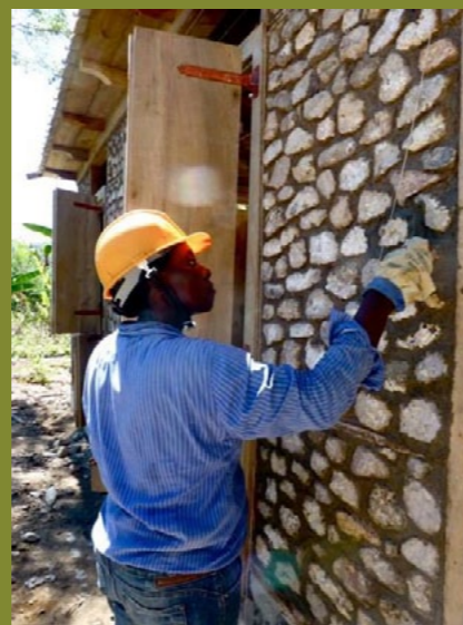
Liens ► Visitez le site de CRAterre