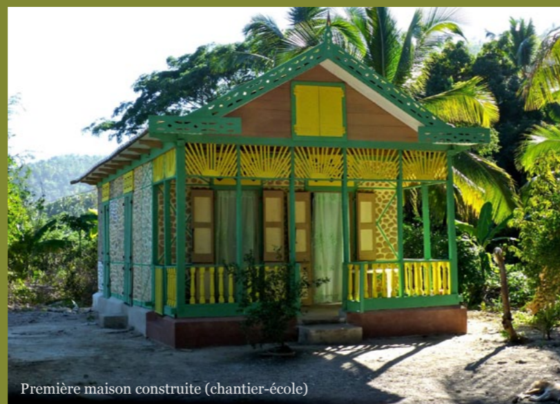
Première maison construite (chantier-école)

Par la suite, les artisans formés deviennent les contremaîtres des 59 autres chantiers. ATECO est garant de la qualité des constructions et de la bonne gestion logistique des chantiers.