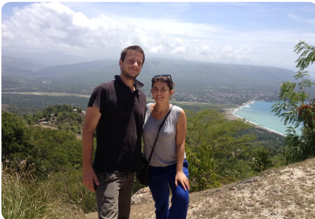
En arrière plan: la baie de Jacmel

..... N'hésitez pas à réagir à cette lettre d'information, à la partager ou à la commenter!