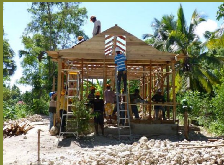
Images du chantier-école