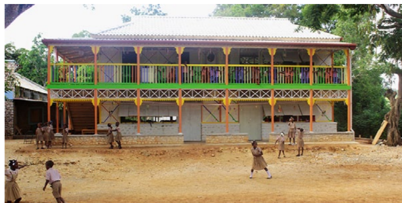
Ecole de Grand-Boulogne (Thomazeau) construite en ossature bois Rôle d'Entrepreneurs du Monde: Supervision et formation d'artisans