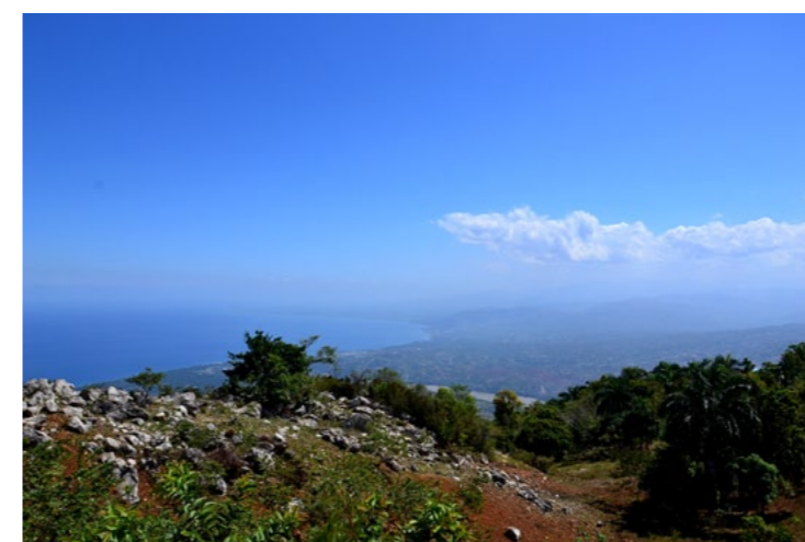
Vue sur la baie de Grand-Goâve depuis les montagnes de Vallée

Nous apporterons aussi notre soutien dans la formation d'artisans pour que les techniques constructives locales soient redécouvertes et réutilisées, en intégrant des améliorations para-sinistres.